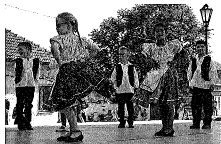
Felléptek a helyi művészeti csoportok.

utalványt nyert, a 2-3. helyezett pedig ajándécsomaggal gazdagodott. ROZSIK RITA