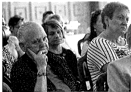
Többen eljötték a tanácskozársra.

felelő gyalogos és kerékpáros közlekedésre, illetve a passzív biztonsági eszközök használatának fontosságára. Az interaktív előadás végén a rendőr válaszolt a kicsiknek és nevelőiknek a feltett kérdésekre, majd láthatósági karszalagot adott ajándékba. HBN