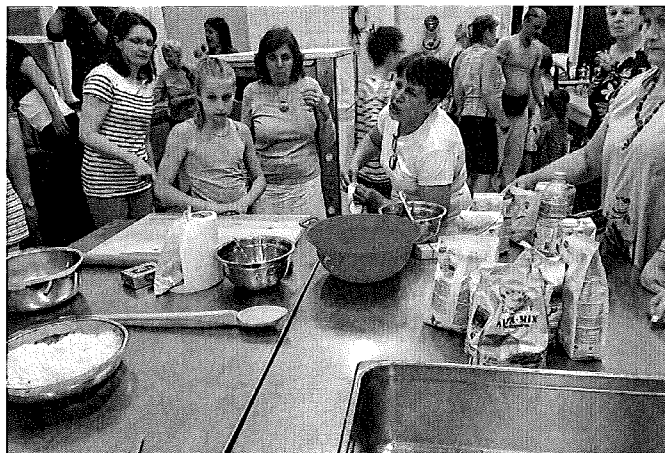
Alapanyagok az asztalon, kezdődhet a sütés-főzés.

A Lisztérzékenyek Érdekvédelmi Egyesülete szervezésében Budapestől három csoport már harmadik alkalommal érkezett a város kollégiumának konyhájára, hogy megtapasztalják, ott miként működhet, és mitől lehet sikeres a diétás étel-készítés. Emellett a látogatás célja volt még, hogy megismerjék a helyi csoport már országos hírűvé vált tevékenységét. Az újfalui csoport 2016 novemberében alakult. Működésük során a Berettyóújfalui és a város környéki lisztérzékenyek, illetve étel-intoleranciában szenvedők (glutén-, tej-, laktóz-, szója, kukorica-, rozs-, tojásérzékenység) számára nyújt segítséget, az ezzel kapcsolatos „új” étel- és étkezési mód és megismerésével foglalkozik.